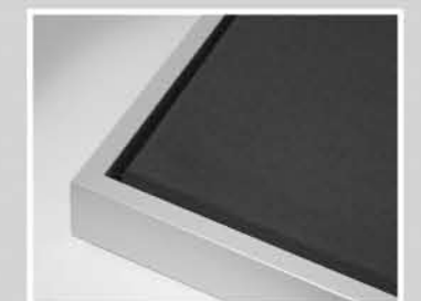
Alu-Keilrahmen mit Schattennutprofil Eloxal silber matt, Abmessung: 13,3/45/44,8 mm

Weitere Informationen und Produkte finden Sie unter www.akustikkunst.de