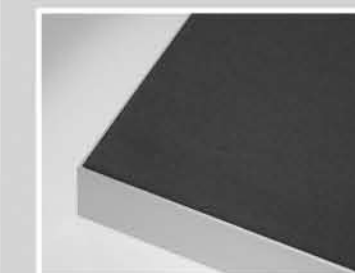
Aluminiumrahmen Alu-Connect 40-1 Eloxal silber matt